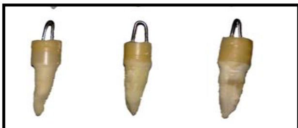
شکل ۲: نمایش گروه‌های مورد مطالعه با سه روش پس از ترمیم کامپوزیتی تاج

در تمامی مراحل اجرای طرح، کلیه دندانها در محلول نرمال سالین و در دمای ۳۷ درجه سانتی گراد قرار می‌گرفتند. در تمام نمونه‌ها در حین ترمیم تاج یک سیم ارتودنسی ۰/۹ (Dentaurum Remanium, Pforzheim, Germany) به شکل قلاب دو میلی‌متر بالاتر از CEJ و دقیقاً در راستای محور اکزیالی دندان در کامپوزیت رزین قرار داده شد تا متعاقباً برای کشش نمونه‌ها استفاده گردد. سپس دندانها به شکلی در آکرلیل سلف کیور مانع گردیدند که مجموعه بازسازی شده تاج کامپوزیتی عمود بر محور افق باشد. (شکل ۲)