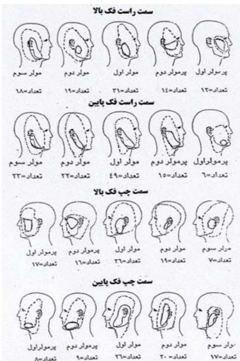
شکل ۲: الگوهای ارجاع درد دندانهای ماگزیلا و مندیبل طرف راست و چپ به نواحی خارج دهان، خطوط پیوسته نواحی شایعتر ارجاع درد و خطوط نقطه چین نواحی ارجاع درد با شیوع کمتر می‌باشد.

ناشی از بیست دندان خلفی فک بالا و پایین به طور جداگانه بررسی شد حجم وسیعی از آنالیز داده‌ها وجود داشت که سعی گردید جهت فهم و مقایسه بهتر، آسانتر و سریعتر، کل اطلاعات در قالب جداول ۱ و ۲ ارائه شود. در این جداول توزیع فراوانی و درصد ارجاع درد در نواحی مختلف سرو گردن، به ترتیب از شایعترین محل ارجاع تا کمترین محل ارجاع تنظیم شده است، به عنوان مثال محل ارجاع درد دندانهای خلفی