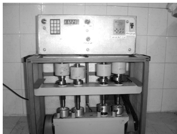
شکل ۴: دستگاه Cyclic Loading و نمونه‌ها در حال آزمایش