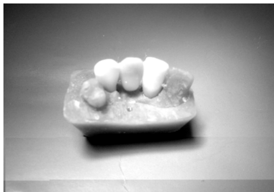
شکل ۲: پونتیک در محل مناسب قرار گرفته و به وسیله کامپوزیت در بخش باکال به طور موقت ثابت شده است.

پس از اچینگ نواحی مینایی ۱۵ ثانیه و عاجی پنج ثانیه با اسید فسفریک ۳۷٪ (Etching gel NSI, Australia) شستشو به مدت ۱۵ ثانیه با آب و خشک کردن، به تمامی نواحی به مدت ۱۵ ثانیه ماده باندینگ عاجی Excite (Ivoclar