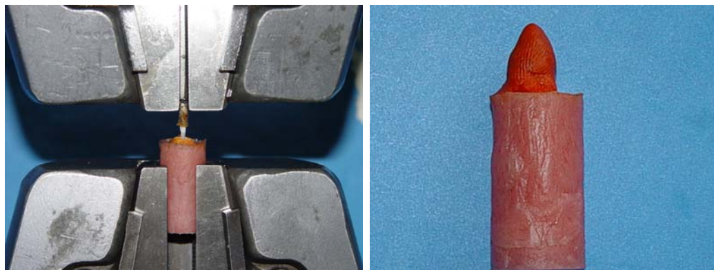
شکل ۳: اعمال نیرو با دستگاه اینسترون