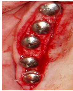
شکل ۳: ایمپلنت ها تا حد امکان نباید روی یک خط مستقیم باشند

پروتز موقتی که برای بارگذاری فوری ساخته شده نباید کانتی لور خلفی داشته باشد. چرا که کانتی لور خلفی از نظر زیبایی اهمیت نداشته و به علت بالا بودن نیروهای جوشی در ناحیه خلفی اثر مخربی روی ایمپلنت ها خواهد گذاشت. به علاوه این پروتزهای موقت را باید با سمان دائم چسباند چرا که اگر سمان در قسمتی از پروتز از بین رود، کانتی لور به وجود خواهد آمد. (۲۹)